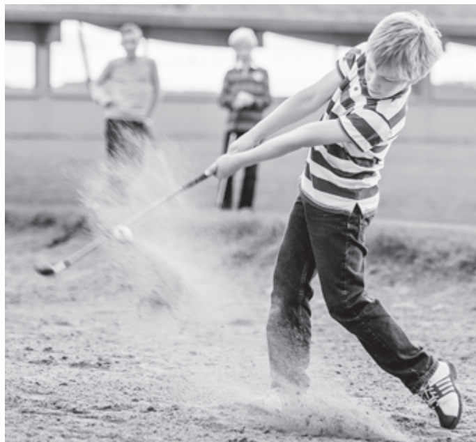
Spaß am Golfen für den Nachwuchs bietet der Golfclub Reutlingen-Sonnenbühl.

Viele weitere Informationen zum Golfen für Kinder und Jugendliche im Sonnenbühler Golfclub findet man zudem direkt unter www.albgolf.de/jugend . Also einfach mal reinschauen oder mit Fragen direkt an Dirk Herrmann wenden.